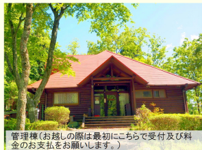
管理棟(お越しの際は最初にこちらで受付及び料金のお支払をお願いします。)

※1・・・食器・調理器具には「おわん(コテージ定員分)」「皿(大・小 それぞれコテージ定員分)」「包丁」「玉しゃくし」「しゃもじ」「箸」「急須」「まな板」「湯のみ(コテージ定員分)」「炊飯器」「鍋(大・小 各1)」「フライパン」「やかん」が含まれています。箸とコップのご用意はございません。また、当施設では食材の手配は行っておりません。 ※2・・・シャワー室にボディーソープ・シャンプー・リンス類のご用意はございません。 ※3・・・寝具は毛布と丸太製の枕のみとなっております。布団の用意はございません。お持ち込みいただくか、寝袋のレンタル(1組 500円)をご利用ください。 ※4・・・テントサイトは車の横付けが可能です。電源の用意はございません。 ※5・・・温水シャワーと洋式トイレは同室となります。