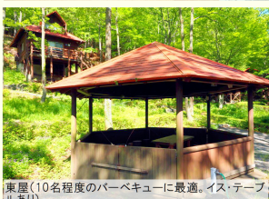
東屋(10名程度のバーベキューに最適。イス・テーブルあり)