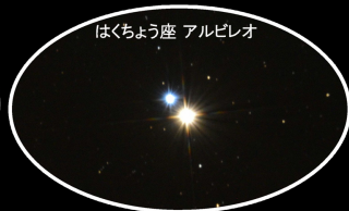
はくちょう座 アルニラム