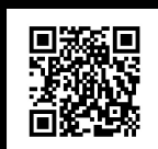
美郷町公式観光情報サイト

(内容は令和3年3月現在のものです。諸事情により変更させていただく場合がございます。)