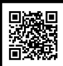
中小屋天文台「昴ドーム」Facebookページ