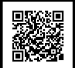
スカイロッジ銀河村HP