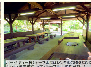
バーベキュー棟(テーブルにはレンタルのBBQコンロがセット出来ます。イス・テーブルは移動可能。)