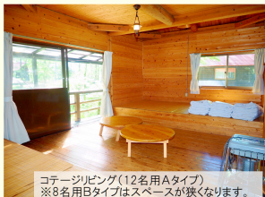
コテージリビング(12名用Aタイプ) ※8名用Bタイプはスペースが狭くなります。