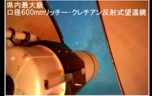
県内最大級 口径600mmリッチー・クレチアン反射式望遠鏡