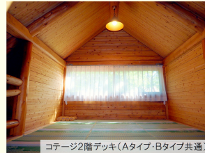
コテージ2階デッキ(Aタイプ・Bタイプ共通)