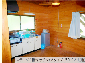
コテージ1階キッチン(Aタイプ・Bタイプ共通)