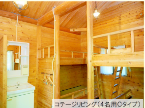
コテージリビング(4名用Cタイプ)