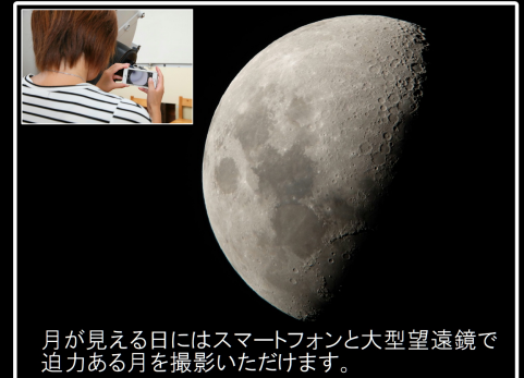
月が見える日にはスマートフォンと大型望遠鏡で迫力ある月を撮影いただけます。