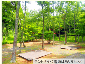
テントサイト(電源はありません)